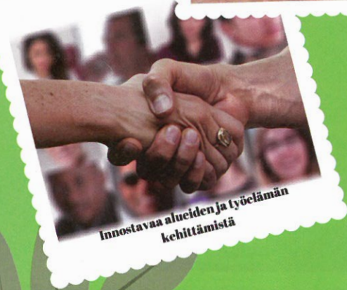
Innostavaa alueiden ja työelämän kehittämistä