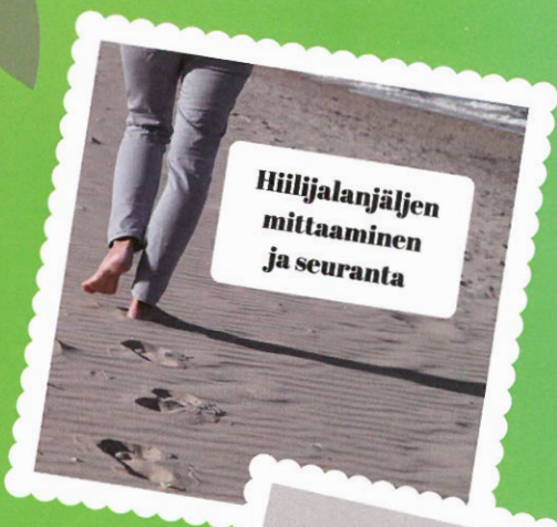
Hiilijalanjäljen mittaaminen ja seuranta