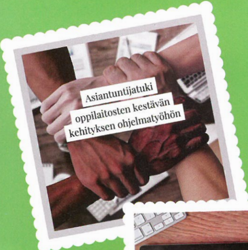
Asiantuntijatuki oppilaitosten kestävän kehityksen ohjelmatyöhön