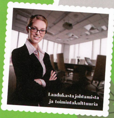
Laadukasta johtamista ja toimintakulttuuria